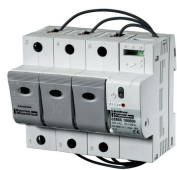
Linocur® 05863.063000 + 05860.100000